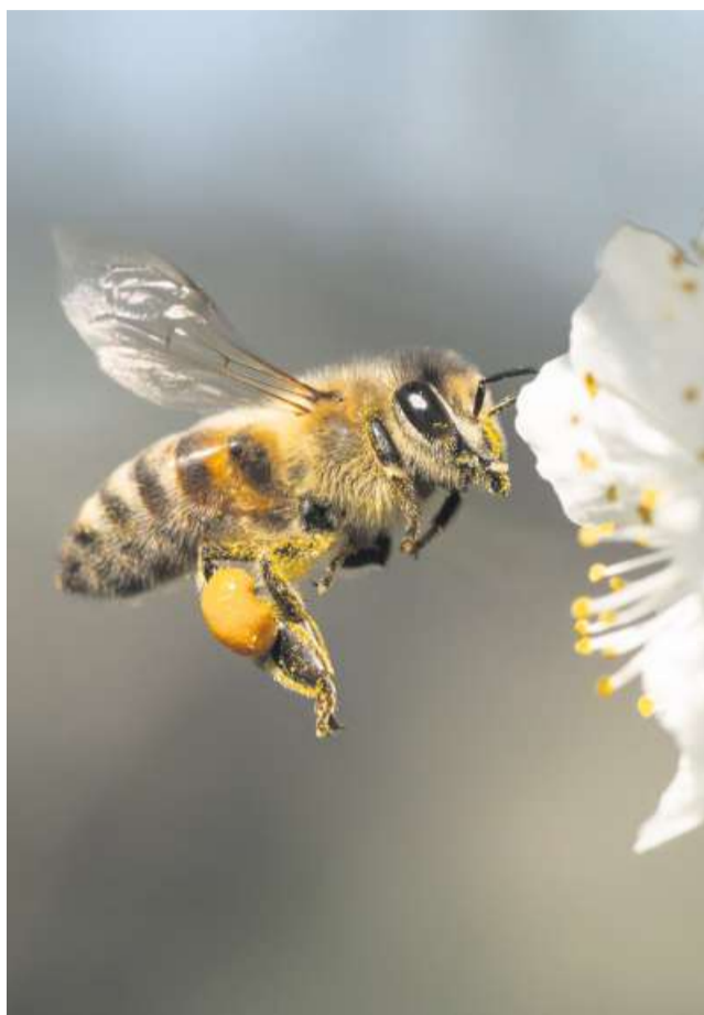
Eine Honigbiene (links) sammelt Nektar bei einer Blüte und steht in direkter Nahrungskonkurrenz zu den Wildbienenarten wie der dunklen Erdhummel (rechts).

Bei dieser Einschätzung stützt sich die Stadt unter anderem auf eine unabhängige Studie der Eidgenössischen Forschungsanstalt für Wald, Schnee und Landschaft (WSL) von 2022. Diese vergleicht die Zahl der Grünflächen in ausgewählten Schweizer Städten mit der Anzahl Bienenvölker, die sich von den Blüten auf diesen Flächen ernähren müssen. Und sie kommt zu dem Schluss: In der Stadt Zürich gebe es zu viele Bienen und zu wenig Flächen, auf denen sie Nektar sammeln könnten. Leidtragende dieser Unterversorgung seien höchstwahrscheinlich die Wildbienen. Der WSL-Forschungs-